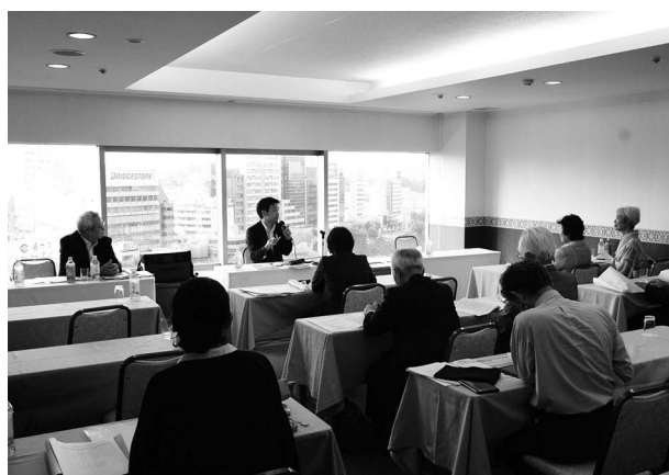
パネルディスカッション風景