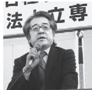
来賓あいさつを述べる杉野剛文部科学省生涯学習総括官

杉野総括官の説明後、新たな学校種創設に関して、今後の見直しなどの質疑が行われたほか、職業教育のための設置基準は既存の高等教育機関にとらわれない、時代のニーズに相應しいものとするべきなどの意見が出された。